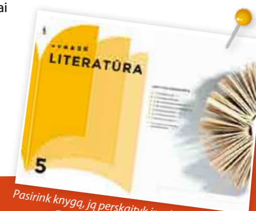
Pasirink knygą, ją perskaityk ir pristatyk!*