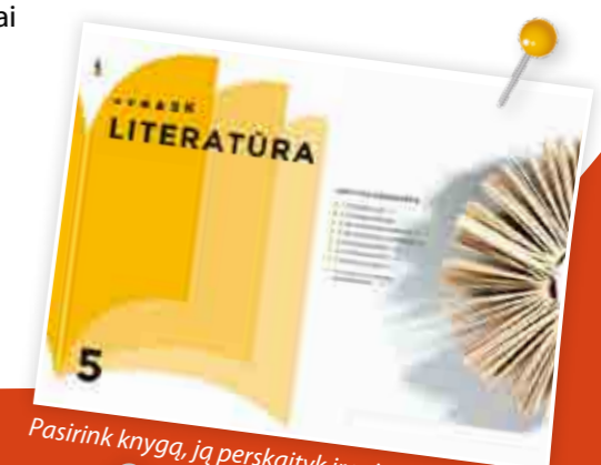
Pasirink knygą, ją perskaityk ir pristatyk!*